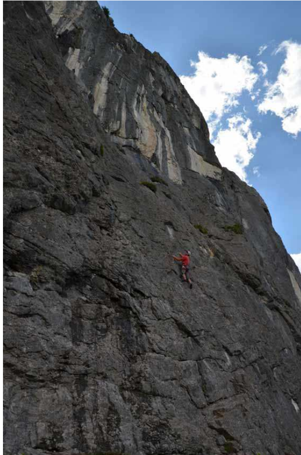
Nulle raison de pas niquer, 6a+

LA FACETTE OUEST, haute jusqu'à 150 mètres, présente des voies homogènes sur des dalles raides à l'escalade souvent technique sur petites prises, citons « Miss Cow drague » et « NCIS » en 6c, Le « Marchand de tapis volants » en 6b, « Le diable en Prada » en 6a, pour l'instant la plus longue voie facile de La Marchande.