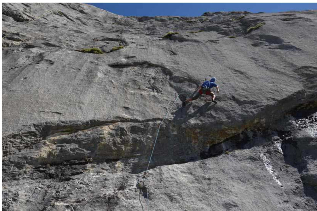
Games of drôles

Du coup, il y en a pour tous les goûts et pour tout le monde... ou presque ! Un régal de calcaire gris et frais qui fait grand bien aux doigts, avec vue plongeante sur le village Les Diablerets et la vallée des Ormonts.